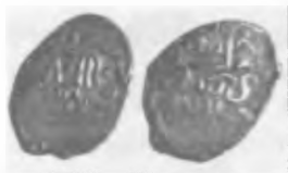
Монеты Крымского ханства (XVI в.)

мах. Макарий устраивал всех, что и стало причиной его долгого и безопасно-го управления Русской православной церковью. Новый глава правительства считал, что Макарий, в отличие от предшественника, не будет вести самостоятельной политики и не окажет существенного влияния на Ивана IV.