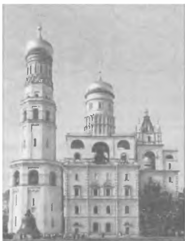
Колокольня «Иван Великий» в Москве (XVI в.)

Своей первой задачей боярство считало восстановление всевластия и введение аристократического образа правления. Любые перемены в верхах следовало проводить быстро, не затрагивая при этом чести и достоинства правящей династии (то есть малолетнего великого князя). Еще недавно, во время мятежа князя Андрея Старицкого, московские посадские люди участвовали в волнениях, которые едва не вылились в открытый и очень опасный бунт. Однако теперь вряд ли кто-либо вступился бы за еще