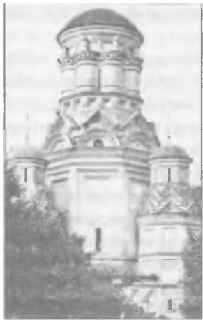
Церковь Усекновения главы Иоанна Предтечи в Подмоскovie (1547)

прощение и своему брату Семену, который уже несколько лет переезжал от врага к врагу, рассчитывая отомстить отечеству за свое изгнание. Однако такого изменника даже малолетний Иван IV, желающий пока всем добра, простить не мог.