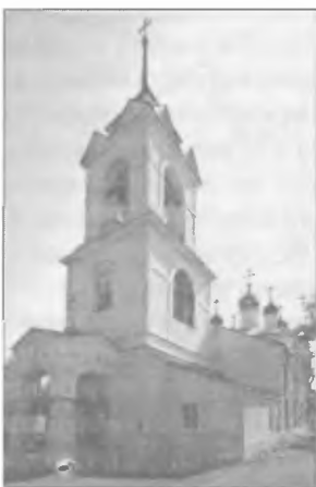
Флоро-Лаврская церковь под Москвой (перестроена в XVII в.)

Государственные дела пришли в упадок, ими никто не занимался, на местах неспешно продолжалась губная реформа. В помощь старостам избирались целовальники, которые взяли на себя нелегкое дело борьбы с «лихими людьми». Казань вступила в переговоры и постоянно затягивала их, пока казанские отряды бесчинствовали в приволжских городах и на восточных окраинах России. За несколько лет казанцы привыкли к безнаказанности, сопровождали грабежи издевательствами и откровенным террором московитов.